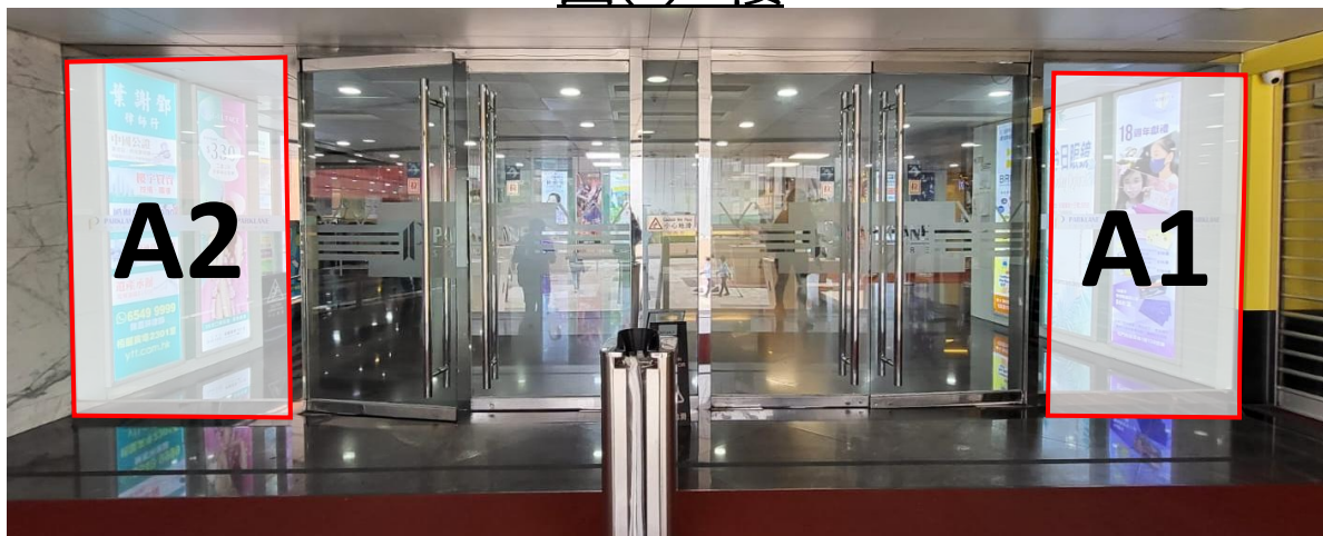
圖(2) 2 樓